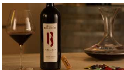
Vini di qualità selezionati da