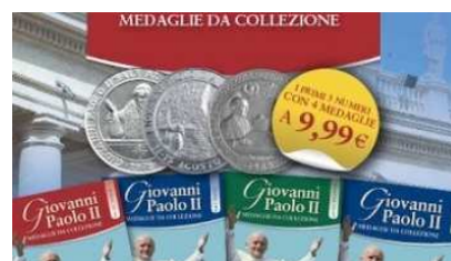
Medaglie da Collezione: preziosi