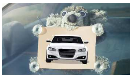
Con UnipolSai la polizza auto è a